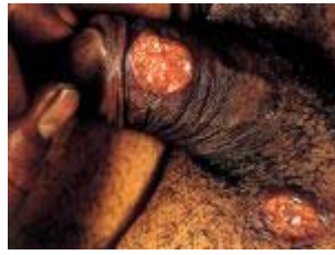
Syfilis: zweer op de penis