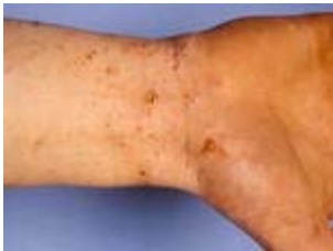
Schurft op de pols