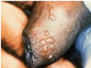
Herpes aan de penis