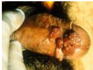
Genitale wratten op de penis