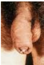
Gonorrhoe aan de penis