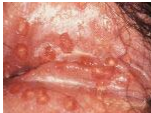
Herpes in de vagina