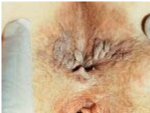
Genitale wratten rond de anus