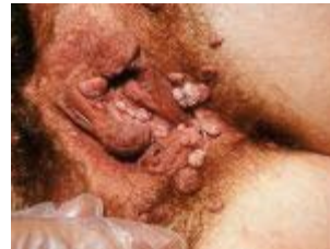
Genitale wratten in en rond de vagina