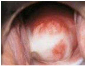
Chlamydia in de vagina