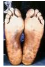
Syfilis: vlekken op de voetzool