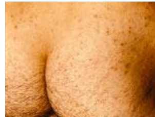
Schurft op het lichaam