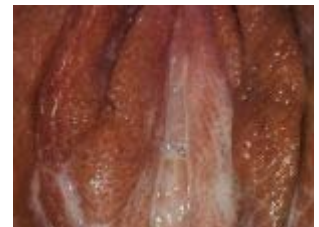
Gonorrhoe in de vagina