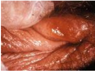
Syfilis: zweer in de vagina