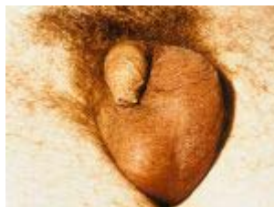
Mogelijk gevolg van gonorrhoe