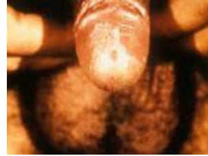
Candida op de penis